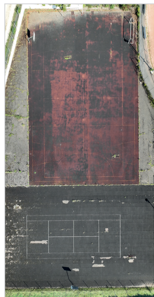
Schritt 1: Zustand vor der Sanierung

Aufgrund der topografischen Gegebenheiten ist die Sportanlage vom Ort aus nicht barrierefrei erreichbar. Es wurde daher beschlossen, zeitnah einen Stellplatz für Menschen mit Beeinträchtigung unmittelbar an der Sportanlage (auf dem Plateau) zu errichten. Von diesem Stellplatz aus sind sämtliche oben beschriebenen Bereiche der Sport- und Freizeitanlage jetzt barrierefrei erreichbar.