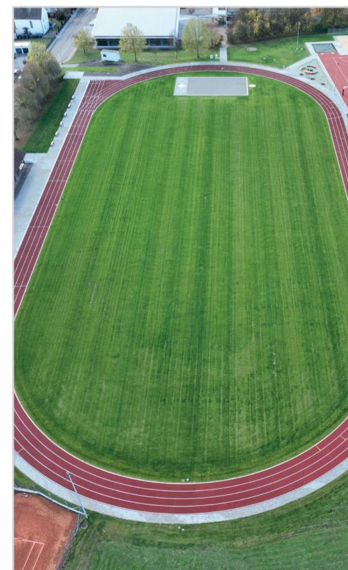
Schritt 6: Fertigstellung