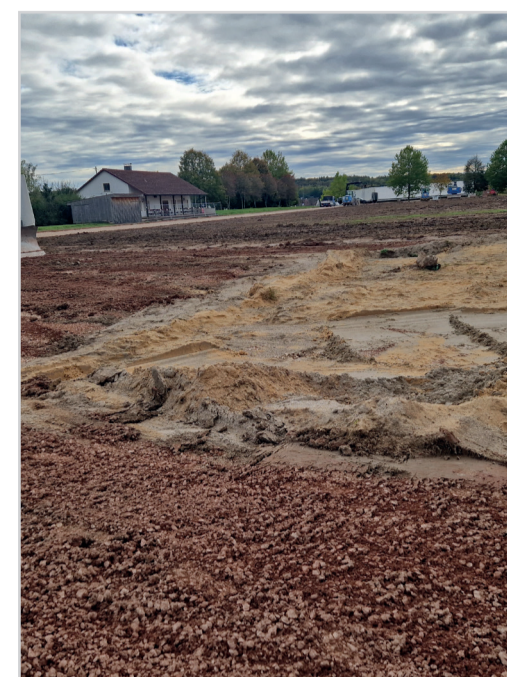
Schritt 2: Bauphase Abbruch