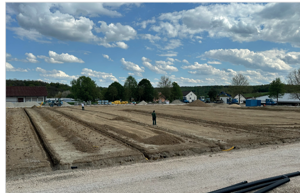
Schritt 4: Bauphase Rasenspielfeld mit Rundlaufbahn und Entwässerung