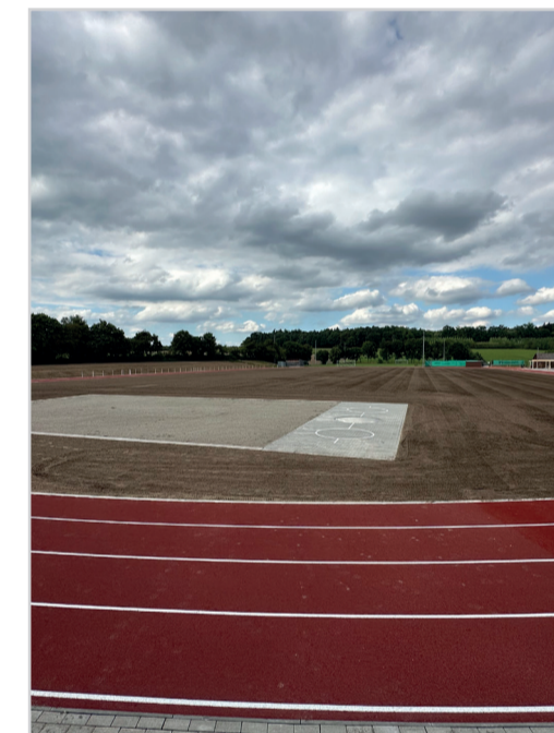
Schritt 5: Bauphase Rundlaufbahn