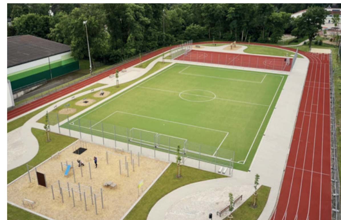
Freizeit- und Sportanlage Augustdorf

Das Projekt stellt insgesamt eine gelungene Umwandlung der ehemaligen Kampfbahn in eine vielseitig nutzbare Sport- und Freizeitanlage dar.