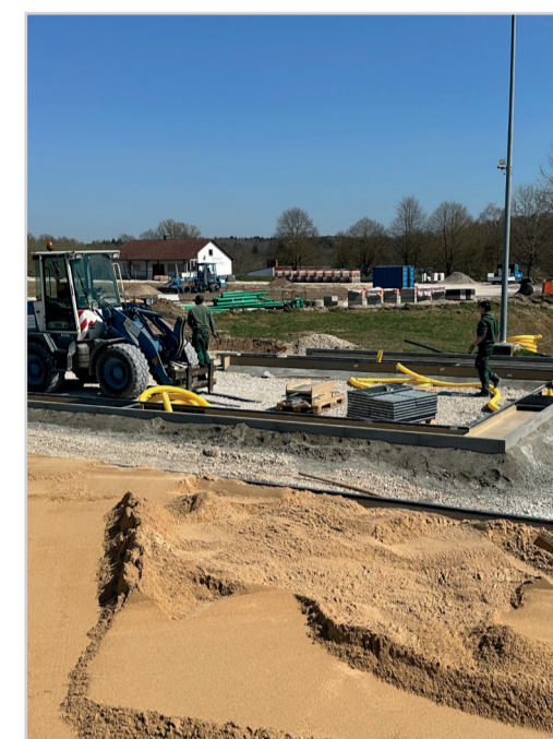
Schritt 3: Aufbau Allwetter Beachvolleyball